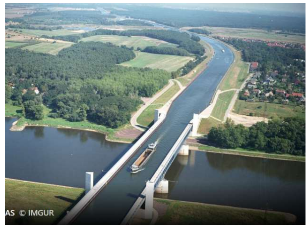
Kanalbro ved Magdeburg i Tyskland

Stadsingeniøren har haft en udfordring – skal den løses med en lyskurv eller en rundkørsel – det sidste kunne ellers være sjovt at se – men det blev 2 niveauer i stedet.