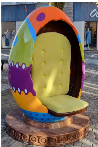
Lidt specielt "Kinderæg" Set i Lemvig.